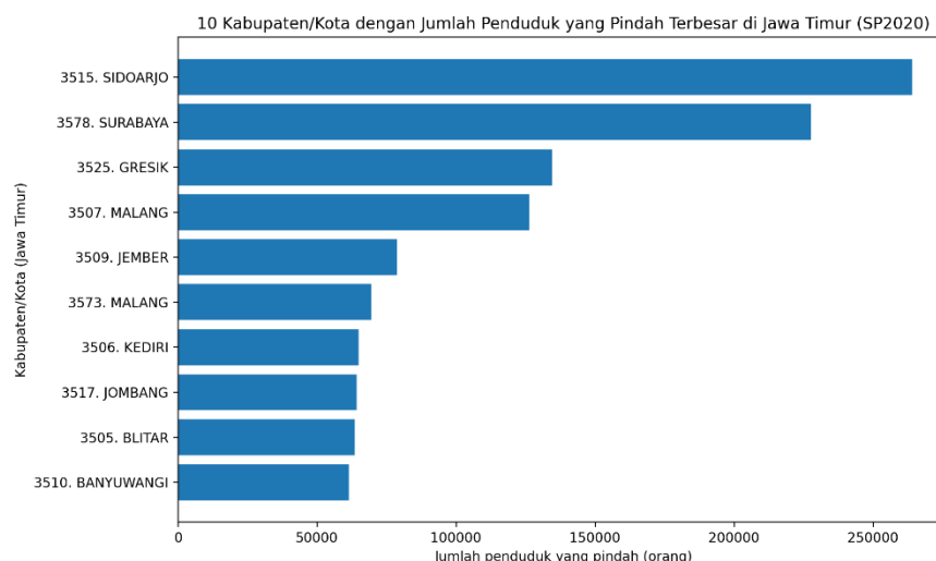
Gambar 3. 10 kabupaten/kota dengan perpindahan terbesar

Sebagai pembanding konteks regional, data SP2020 menunjukkan kabupaten/kota dengan jumlah penduduk pindah terbesar di Jawa Timur mencakup Sidoarjo, Surabaya, dan Gresik (wilayah yang kuat sebagai pusat industri/urban). Ini memperkuat hipotesis tarikan wilayah tujuan di sekitar pusat kegiatan ekonomi dan pendidikan. Berikut 10 kabupaten dengan tingkat perpindahan terbesar.