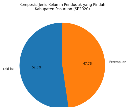
Gambar 3. Komposisi jenis kelamin

Berdasarkan visualisasi profil migrasi yang disusun dari tabulasi SP2020, komposisi penduduk Kabupaten Pasuruan yang pindah menunjukkan bahwa laki-laki mendominasi sebesar 52,3%, sedangkan perempuan 47,7%. Artinya, arus migrasi keluar/masuk (sesuai definisi “pindah” pada tabulasi yang digunakan) relatif seimbang, tetapi sedikit lebih banyak melibatkan penduduk laki-laki. Berikut komposisi jenis kelamin penduduk yang pindah di kabupaten Pasuruan.